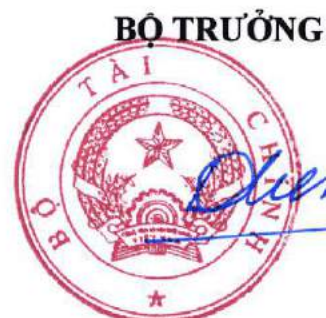
Đinh Tiến Dũng