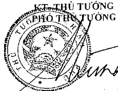
Nguyễn Sinh Hùng