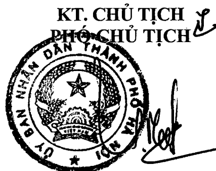
Trần Xuân Việt