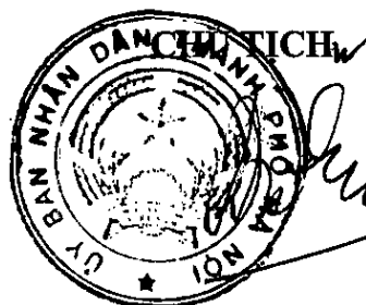
Chu Ngọc Anh