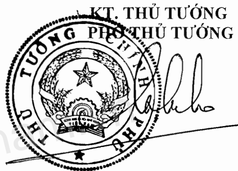
Trương Hòa Bình