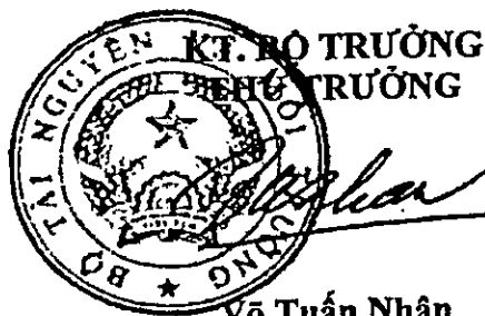
Võ Tuấn Nhân