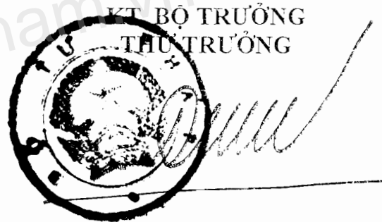
Đinh Trung Tụng