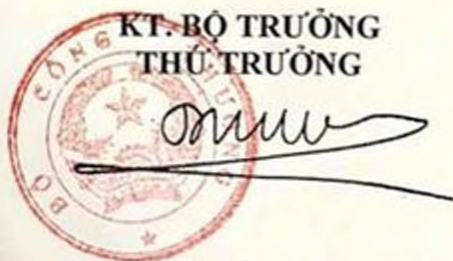
Đỗ Thắng Hải