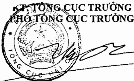
Hoàng Việt Cường