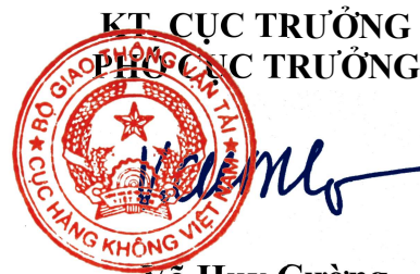
Võ Huy Cường