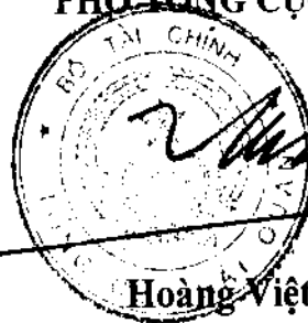
Hoàng Việt Cường