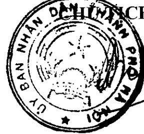
Chu Ngọc Anh