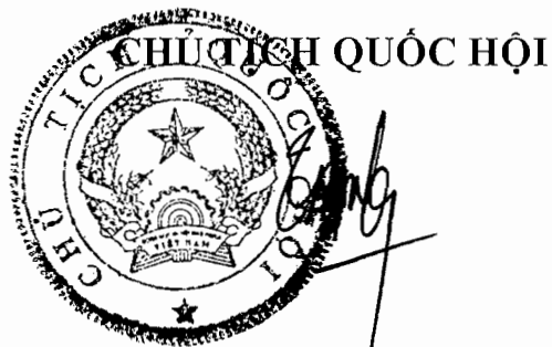
Nguyễn Phú Trọng

Luật này đã được Quốc hội nước Cộng hòa xã hội chủ nghĩa Việt Nam khoá XII, kỳ họp thứ 9 thông qua ngày 29 tháng 3 năm 2011.