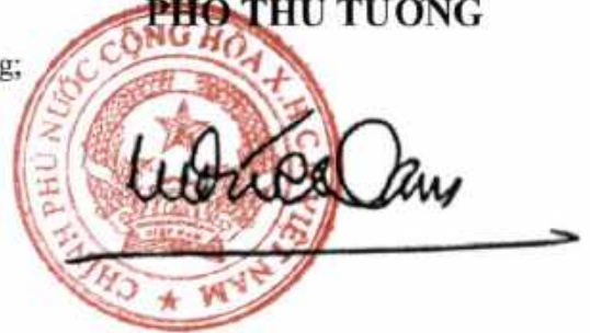
Vũ Đức Đam

TM. CHÍNH PHỦ KT. THỦ TƯỚNG PHÓ THỦ TƯỚNG