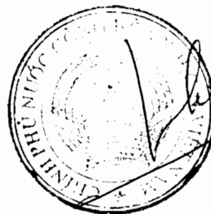
Nguyễn Xuân Phúc