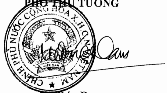
Vũ Đức Đam

TM. CHÍNH PHỦ KT. THỦ TƯỚNG PHÓ THỦ TƯỚNG