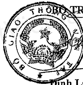
Đinh La Thăng