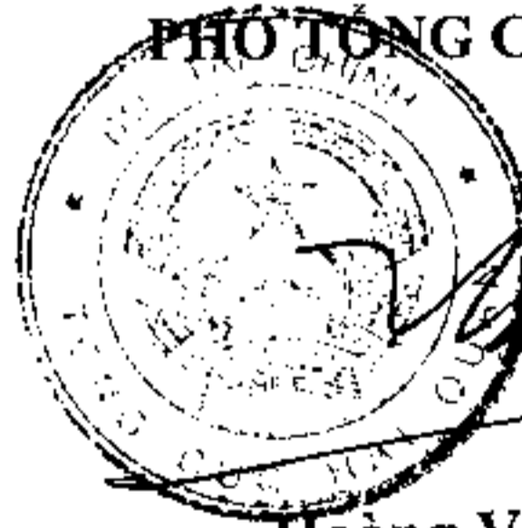
Hoàng Việt Cường