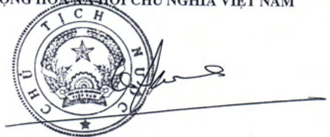
Trương Tấn Sang

CHỦ TỊCH NƯỚC CỘNG HÒA XÃ HỘI CHỦ NGHĨA VIỆT NAM