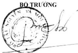
Phạm Khôi Nguyên