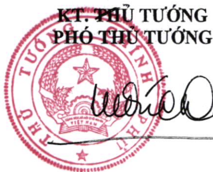
Vũ Đức Đam