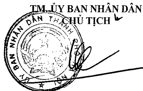
Nguyễn Đức Chung