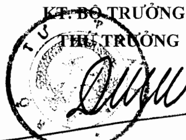
Đinh Trung Tụng