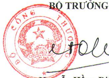
Nguyễn Hồng Diên