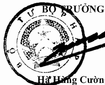
Hà Hùng Cường