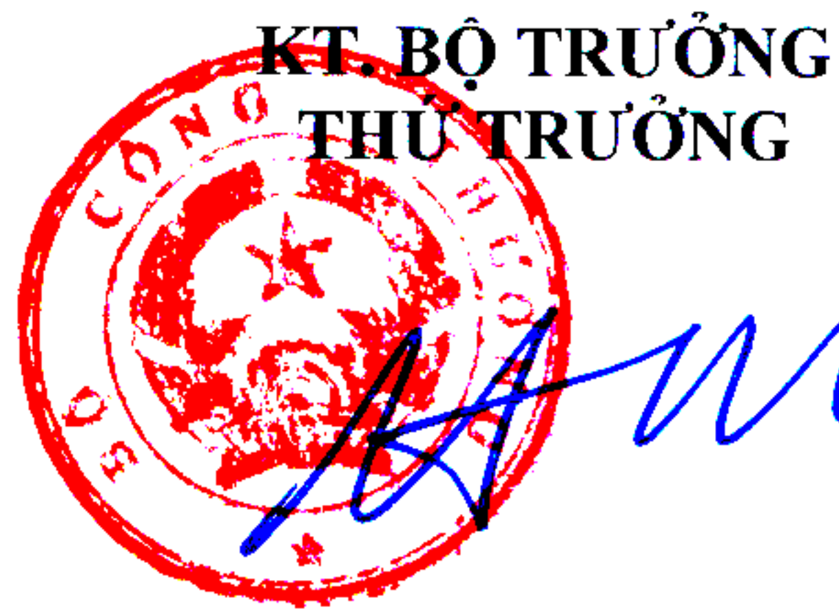
Cao Quốc Hưng