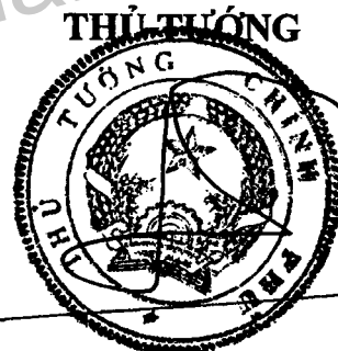
Nguyễn Tấn Dũng

e) Cơ quan chủ trì Đề án, Bộ, ngành liên quan, các tổ chức đoàn thể và địa phương có thể huy động các nguồn kinh phí hỗ trợ từ các cơ quan, tổ chức, cá nhân trong nước và ngoài nước để việc triển khai thực hiện Đề án có hiệu quả./.