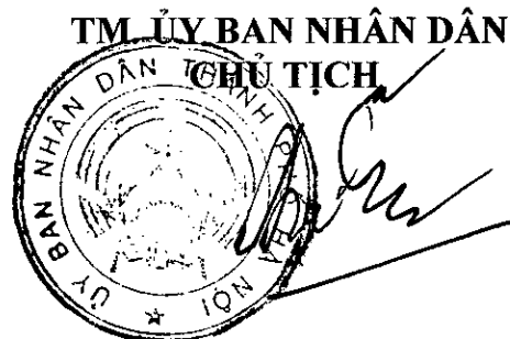
Chu Ngọc Anh