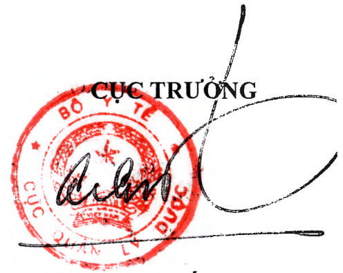
Trương Quốc Cường