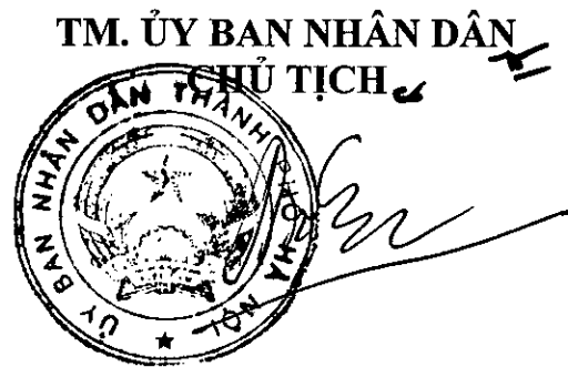
Chu Ngọc Anh