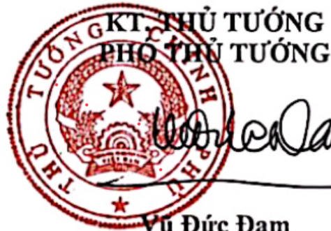
Vũ Đức Đam