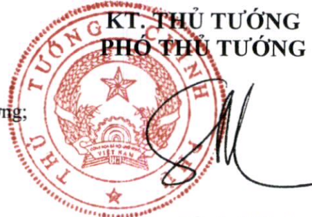
Phạm Bình Minh