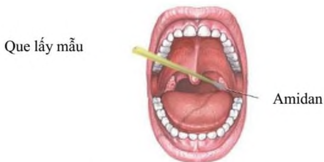
Miết vào 2 bên amidan và thành bên họng

- Đóng nắp, xiết chặt nắp ống bệnh phẩm và bọc ngoài bằng giấy parafin (nếu có).