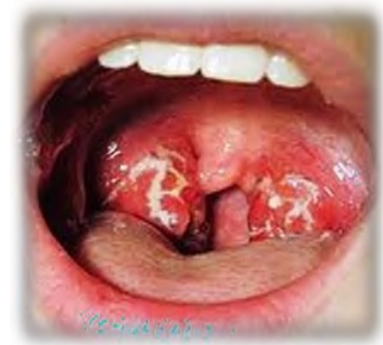
Dùng que lấy mẫu tại vùng có đốm trắng, giả mạc