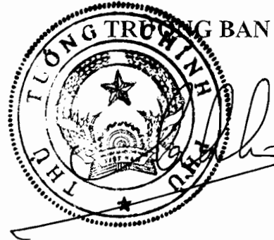
PHÓ CHỦ TỊCH Trương Hòa Bình

2. Trong quá trình thực hiện, nếu có vướng mắc yêu cầu các cơ quan, đơn vị liên quan phản ánh kịp thời về Ban Chỉ đạo 389 quốc gia (qua Văn phòng Thường trực) để tổng hợp, trình Trưởng Ban xem xét, quyết định./.