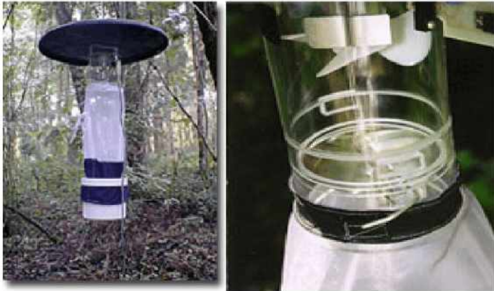
Bẫy đèn CDC

Bẫy đèn: bẫy đèn bắt muỗi có nhiều loại khác nhau: loại dùng nguồn điện 220V; loại khác dùng ắc quy hoặc dùng pin khô thích hợp để bắt muỗi ở những vùng xa xôi, hẻo lánh chưa có điện lưới... cấu tạo của các loại bẫy đèn gồm 5 bộ phận chính: chao bẫy, thân bẫy, nguồn sáng, cánh quạt cùng mô tơ, và lồng đựng muỗi.