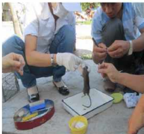
Thu thập bộ chết ở chuột