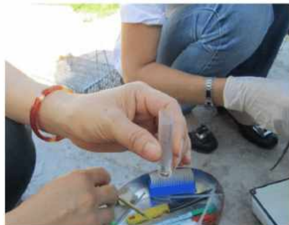
Thu thập và bảo quản mẫu bộ chết vào tuýp chứa cồn 70 0