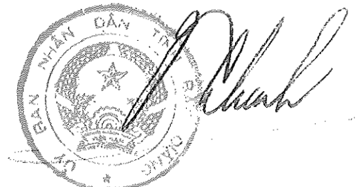
Nguyễn Văn Linh