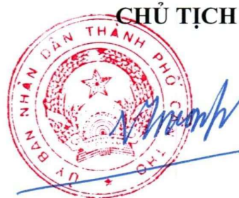
Trần Việt Trường