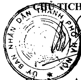
Chu Ngọc Anh