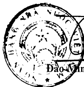
Đào Vinh Tú