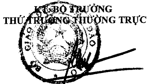
Bành Tiến Long

2. Khi một hoặc cả hai bên liên kết không đáp ứng nhu cầu hoặc không đủ khả năng để tiếp tục thực hiện hợp đồng liên kết giáo dục, đơn vị chủ quản phải báo cáo Bộ Giáo dục và Đào tạo để kịp thời xử lý.