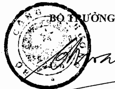
Vũ Huy Hoàng

4. Chánh văn phòng Bộ có trách nhiệm theo dõi, đôn đốc việc triển khai thực hiện nhiệm vụ của các đơn vị, định kỳ báo cáo và kiến nghị với Bộ trưởng về các biện pháp cần thiết, bảo đảm Chương trình được thực hiện hiệu quả và đồng bộ./.