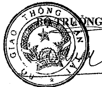
Đinh La Thăng