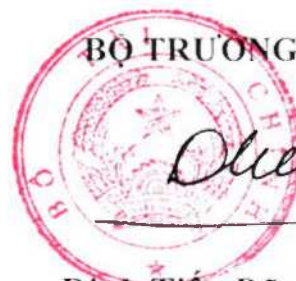
Đinh Tiến Dũng