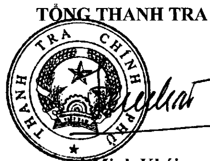
Lê Minh Khái