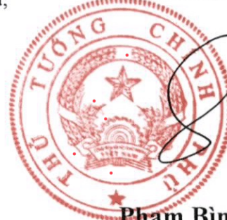
Phạm Bình Minh