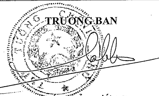
PHÓ THỦ TƯỚNG Trương Hòa Bình