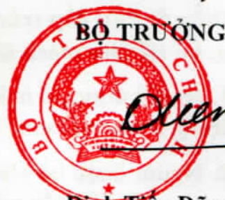
Đinh Tiên Dũng