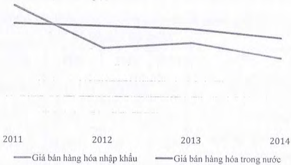
Biểu đồ 2: So sánh giá bán của hàng hoá trong nước và hàng hoá nhập khẩu trong giai đoạn 2011-2014

Nguồn: Tổng cục Hải quan và tổng hợp bản trả lời câu hỏi của các nhà sản xuất trong nước, các nhà nhập khẩu.