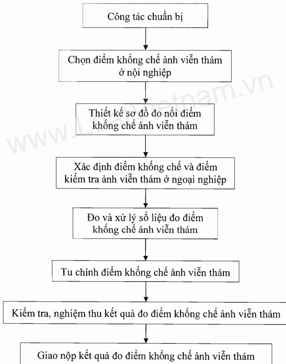
Hình 1: Sơ đồ quy trình đo khống chế ảnh viễn thám