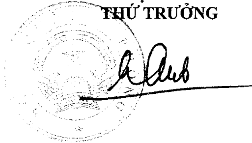
Thượng tướng Phan Văn Giang